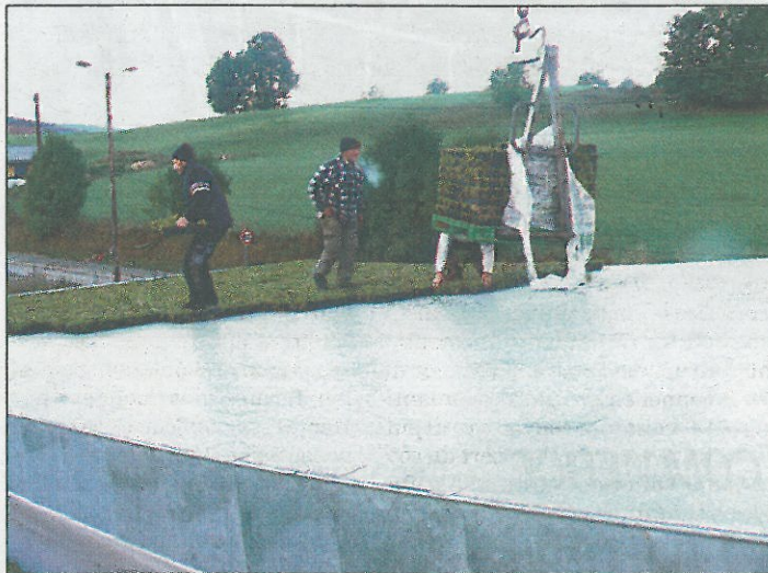
Les porteurs du projet ont choisi de leur couvrir d'une toiture végétalisée posée par l'entreprise Burgunder de Grand'Combe-Chateleu

Le projet doit vivre toute l'année et servir.